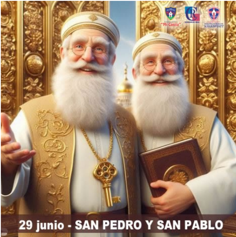
29 junio - SAN PEDRO Y SAN PABLO

¡Este 29 de junio celebramos el día de San Pedro y San Pablo, dos pilares fundamentales de nuestra fe cristiana. San Pedro, primer Papa y roca sobre la cual Jesús edificó su Iglesia, y San Pablo, incansable misionero y autor de muchas epístolas del Nuevo Testamento, nos enseñan la importancia del liderazgo y la evangelización. Su entrega y sacrificio por difundir el mensaje de Cristo nos inspiran a vivir con valentía y compromiso. En esta fecha especial, recordemos su legado y renovemos nuestro compromiso de ser verdaderos discípulos de Jesús.